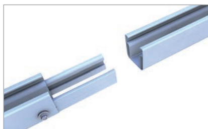
Skinneforbinder C47 S til profilkamre