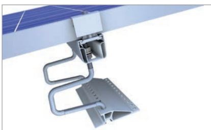
Dobbelttagkroge til store snebelastninger