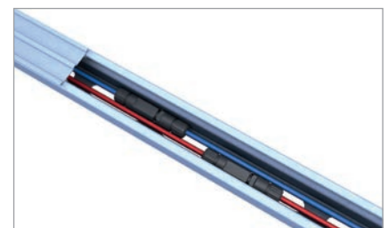
C-Skinne fungerer som kabelkanal